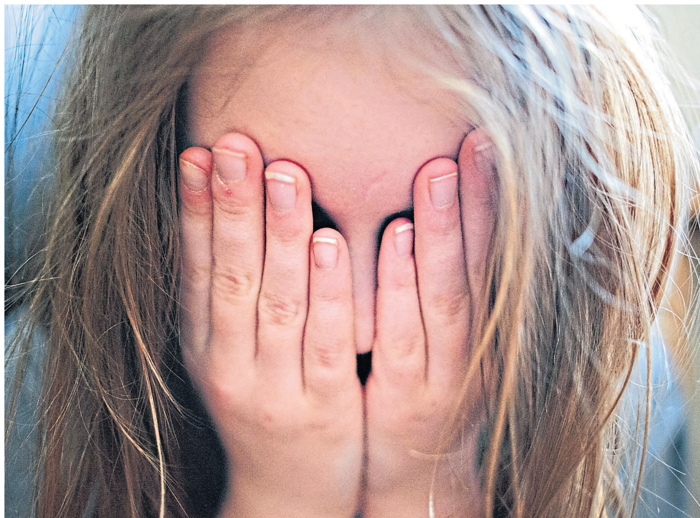
Corona, Pandemie-Maßnahmen und nun der Krieg: Die Krisen reichen bis in die Kinderzimmer.